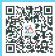
“全国人才流动中心”微信公众号

中方牵头机构： 人力资源和社会保障部国际合作司 中方实施机构： 人力资源和社会保障部全国人才流动中心 详情请登录： 中国国家人才网“青年国际实习交流计划” 专栏 ( Intern.newjobs.com.cn ) 咨询电话： 010-84209135