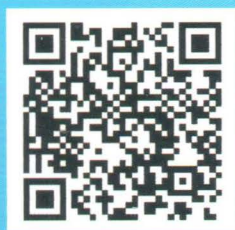
中方实施机构网站专栏二维码